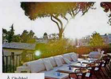
À l'hôtel Ermitage, la terrasse du TIGrr et sa jolie vue sur la ville.