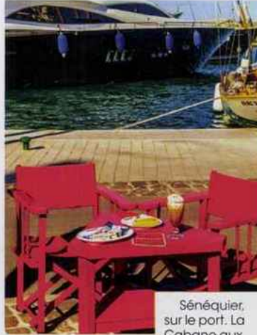
Sénéquier, sur le port. La Cabane aux écureuils, à La Croix-Valmer.

81, boulevard de Gigaro, 83420 La Croix-Valmer. chateauvalmer.com