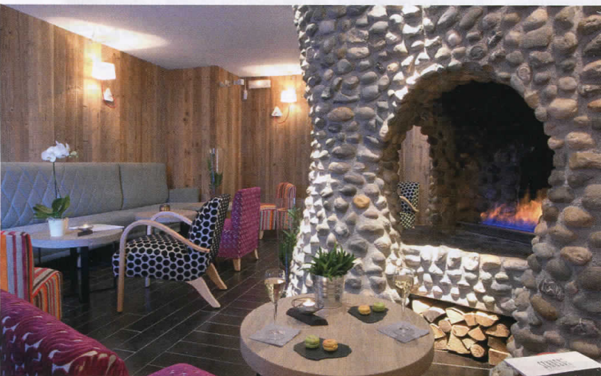
Le Bistro de l'Orée à Méribel

Design et coloré, on testera la carte variée, dans de nouvelles ambiances. On aura le choix de se restaurer vite fait au bar ou confortablement dans l'espace lounge qui permet de grignoter sucré ou salé à toute heure. Tel. : 04 79 00 31 20. www.meribel-oree.com